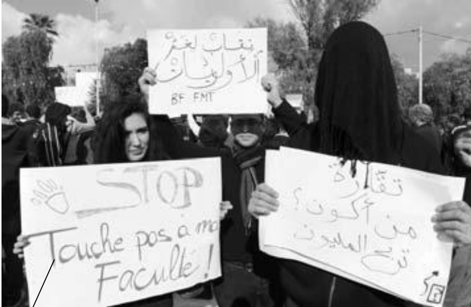
Estudiantes en defensa del campus universitario y la convivencia en las aulas a cara descubierta, ante la sede de la Asamblea Nacional Constituyente